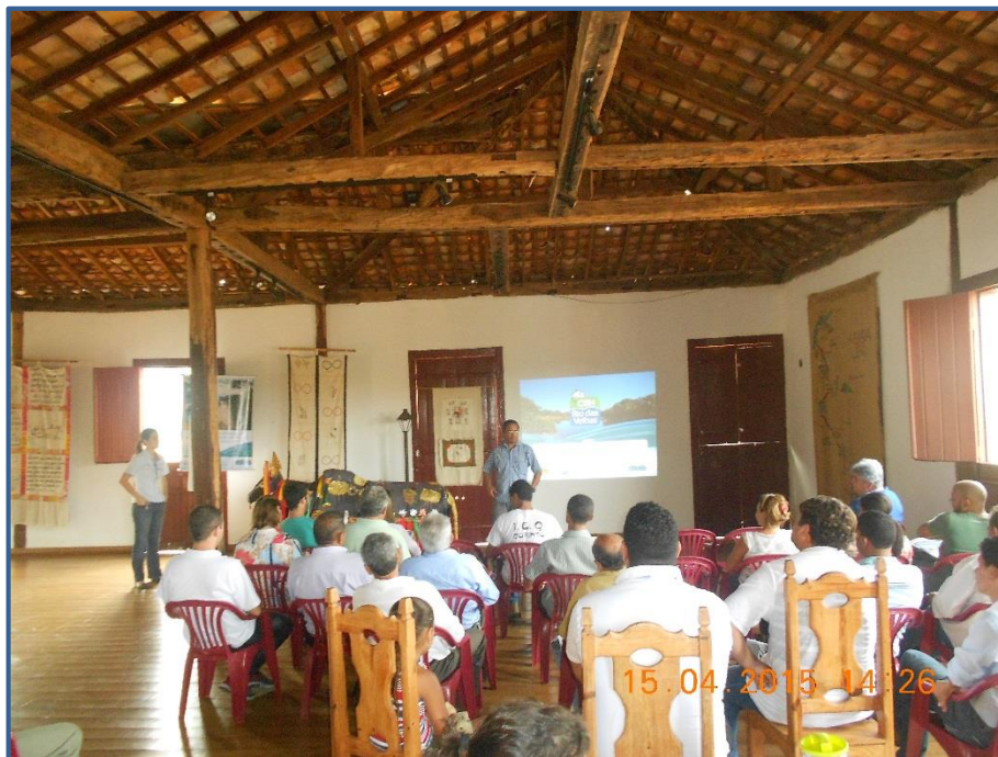
Figura 5 - Pronunciamento do representante da AGB Peixe Vivo

Foi oferecido um lanche aos presentes e a assinatura dos mesmos foi registrada na lista apresentada no Anexo B .