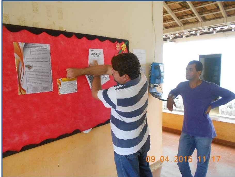
Figura 3 - Divulgação do convite para o seminário inicial