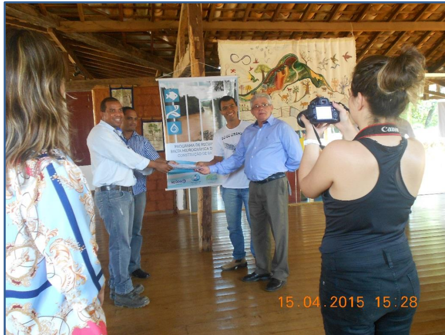
Figura 10 - Registro da abertura do projeto