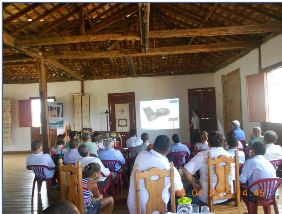
Figura 6 - Mobilizadora social da Neogeo apresentando o projeto