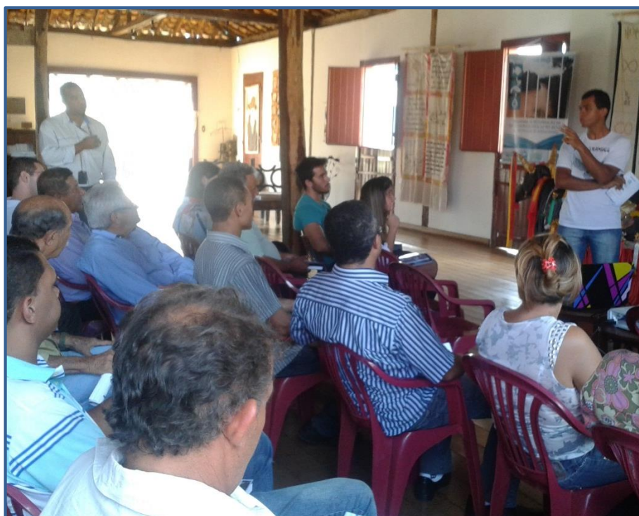
Figura 7 - Esclarecimento de dúvidas do público