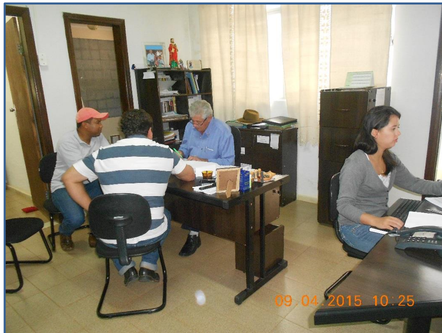
Figura 2 - Reunião na prefeitura municipal de Morro da Garça

As ações iniciais do projeto foram voltadas para o contato entre a Neogeo e os representantes das prefeituras municipais de Corinto e Morro da Garça e do SCBH Rio Bicudo. Este contato expressa o interesse da empresa em conhecer e entender o contexto local. Tal diálogo é sempre muito importante para alinhamento das demandas e propostas relacionadas ao projeto.