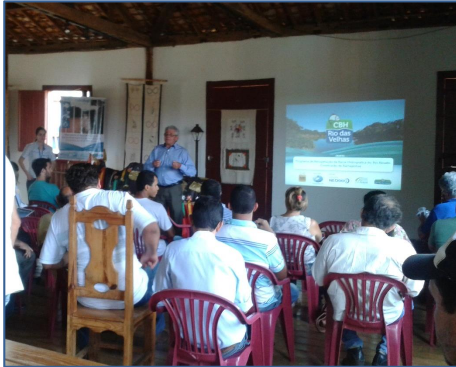
Figura 4 - Abertura do evento pelo Prefeito de Morro da Garça