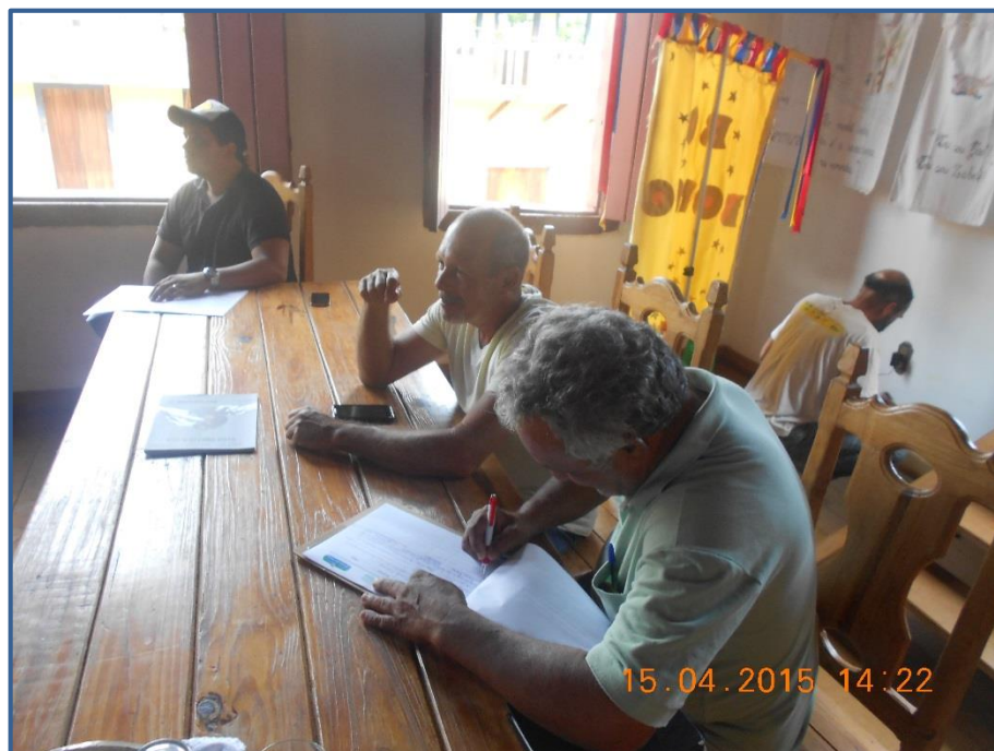
Figura 8 - Registro na lista de presença