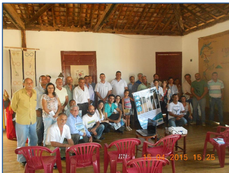
Figura 9 - Público na abertura do projeto